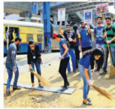
More than 200 Engineering students of VES Institute of Technology participated in the cleanup drive at Chembur Railway Station, yesterday.

The students of Vivekanand Education Society's Institute of Technology (VESIT) yesterday conducted a massive cleanliness drive at the Chembur railway station and in its surroundings. Around 200 engineering students participated in the drive and were helped by the railway and the Brihanmumbai Municipal Corporation (M/ward) officials. Their aim was to get rid of the filth spread across the station and spread the message of a garbage-free Mumbai. The students interacted with the public and made them aware of the impor-